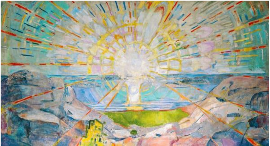
Edvard Munch: De zon (1912)